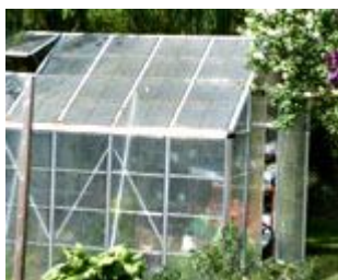
Equipement serre P 7

p16 Calendrier lunaire Comment jardiner avec la lune en février